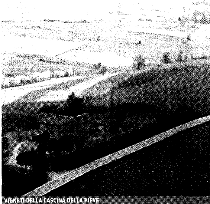
VIGNETI DELLA CASCINA DELLA PIEVE