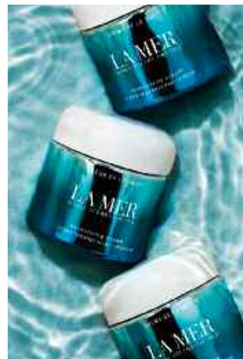
MOISTURIZING CREAM- LIMITED EDITION il ricercato scrigno di Crème de la Mer nel formato 100ml, con un nuovo design in edizione limitata per la Giornata Mondiale degli Oceani.