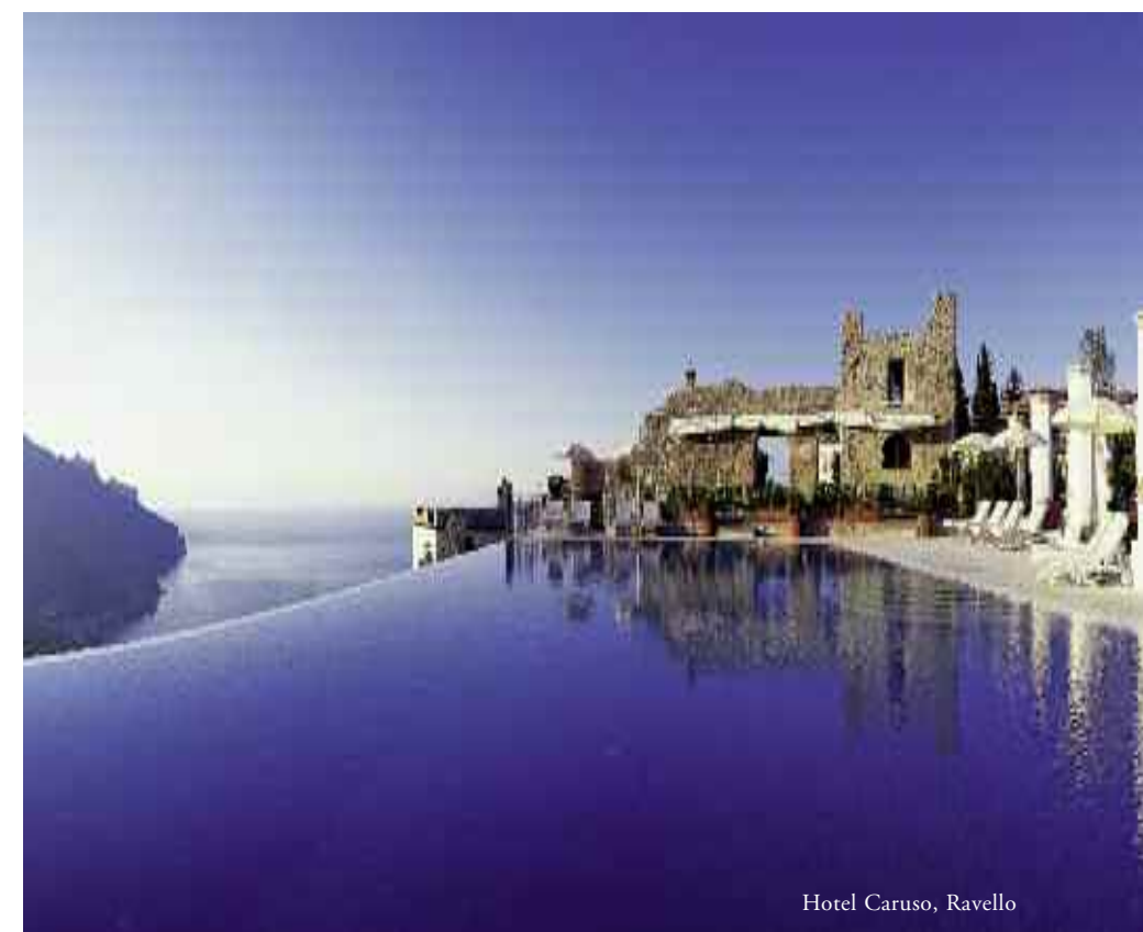
Hotel Caruso, Ravello