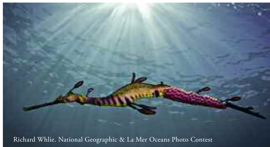
Richard Whlie. National Geographic & La Mer Oceans Photo Contest