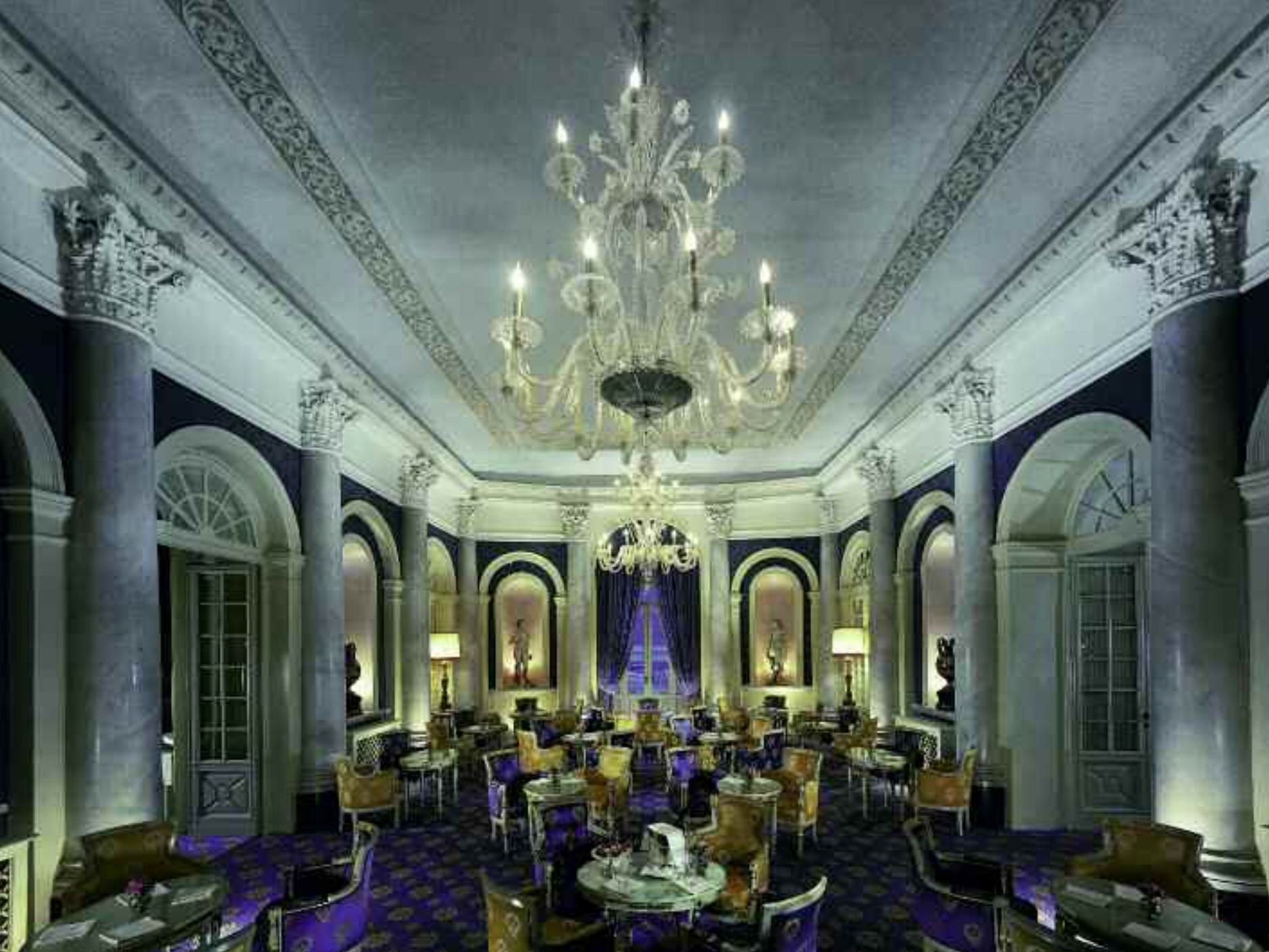
In alto, l'incantevole Bar Canova all'interno dell'hotel Villa d'Este, Cernobbio (lago di Como) Nella pagina a fianco, dall'alto: Borgo Egnazia, Sevelletri di Fasano (Puglia); Grand Hotel Parker's, Napoli; hotel Su Gologone, Oliena Nuoro (Sardegna)