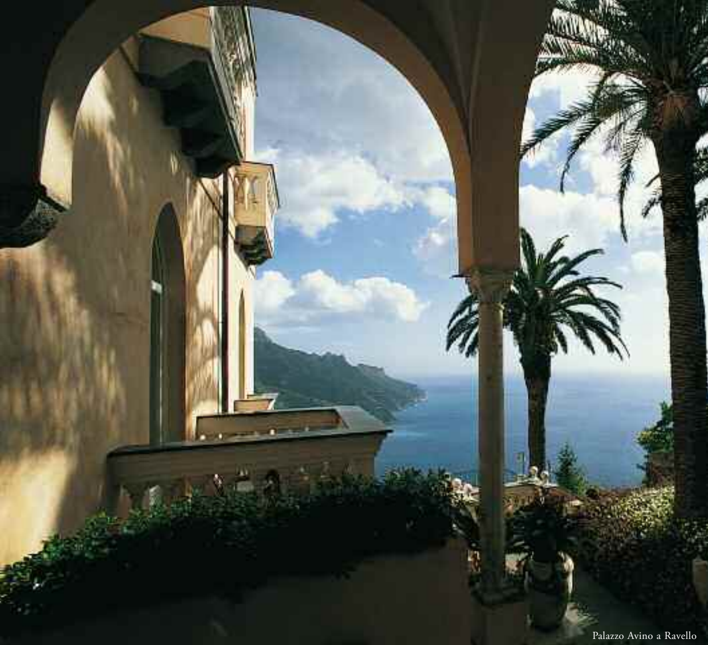
Palazzo Avino a Ravello