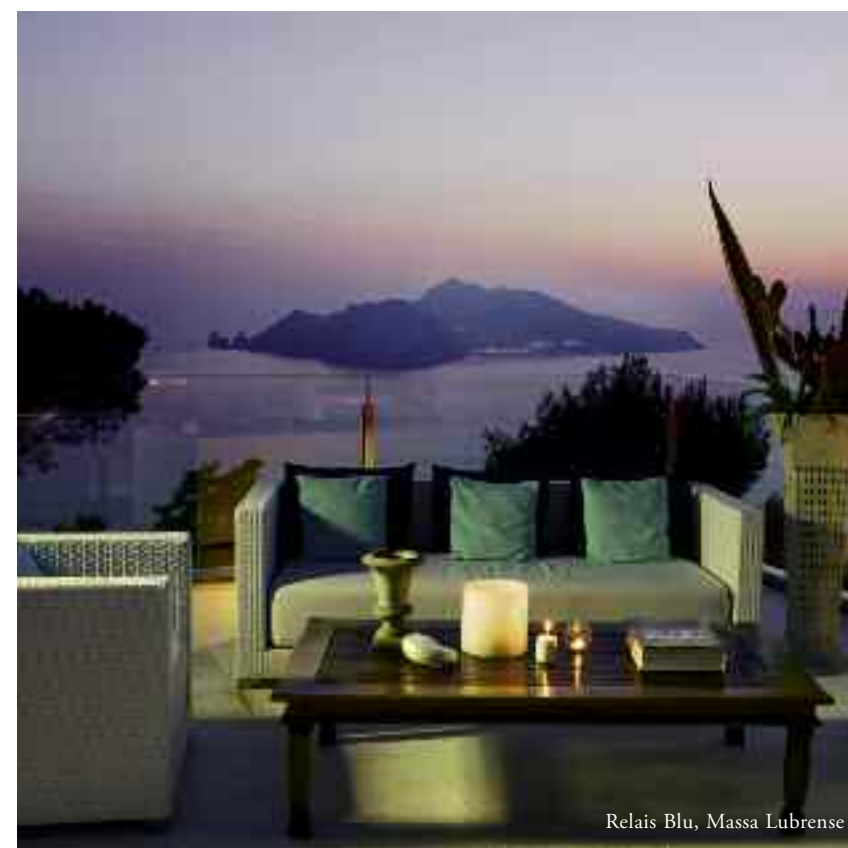
Relais Blu, Massa Lubrense