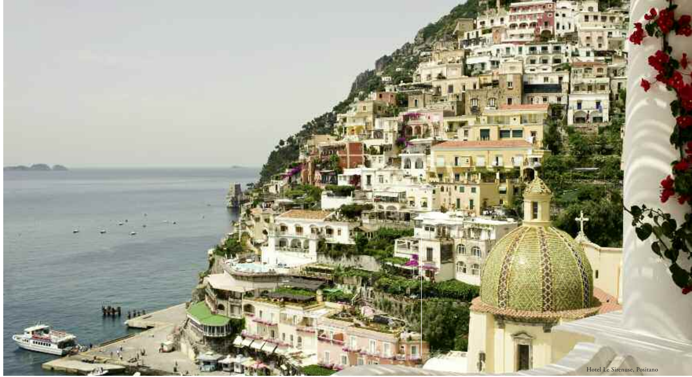
Hotel Le Sirenuse, Positano