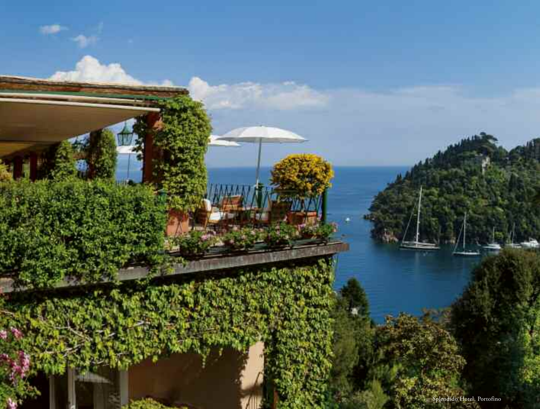
Splendido Hotel. Portofino