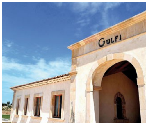
Locanda Gulfi, Chiaramonte Gulfi (Sicilia)